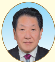
文京区商店街連合会会長