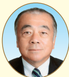
東京商工会議所 文京支部会長

新年おめでとうございます。日頃より、区内商業振興に特段のご尽力を賜り、厚くお礼申し上げます。 昨年は、米価高騰に象徴される物価高や人手不足など、商店街を取り巻く環境の厳しさが続いた一年でありました。その中でも、皆様の創意工夫により、地域の賑わいにつながる様々な取組を進められたことに心より敬意を表します。 区商連では、従来のキャッシュレス決済ポイント還元事業に替わり、文京区共通デジタル商品券発行事業が実施され、多くの区民や在勤者の方などにご利用いただいております。また、謎解きイベント「ぶんきょう坂道ミステリー」は、「ももちフェス2025」でスピンオフ企画が実施されるなど、老若男女楽しめるイベントとして広がりを見せています。 区では、昨年度に引き続き、「文京ソコデカラ」が中心のお店応援キャンペーンとして、各店舗での消費者還元サービスと原材料費等の補助を実施しました。また、本年1月には、文京ソコデカラサイトをリニューアルいたしました。商店の魅力を発信するプラットフォームとして更に発展させてまいります。 本年は午年です。力強く前へ進む馬の姿になぞらえ、挑戦と飛躍の年とも言われております。皆様の取組が地域に活力を生み、本年が貴連合会及び会員の皆様にとって実り多き一年となることを祈念し、年頭のご挨拶といたします。