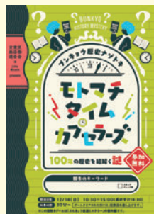
謎解きリーフレット

2025年12月14日（日）本郷で「元町公園リニューアルオープン&もとまちフェス2025」が開催された。イベントの中のひとつには、“ぶんきょう坂道ミステリー”番外編の謎解きゲームが行われた。多くのファミリーが参加し、難問を解いていく楽しい企画になった。また、文商連加盟のTSUKUMI、菓子工房福どら、Coquet（コケ）の3店舗のキッチンカーが出店した。