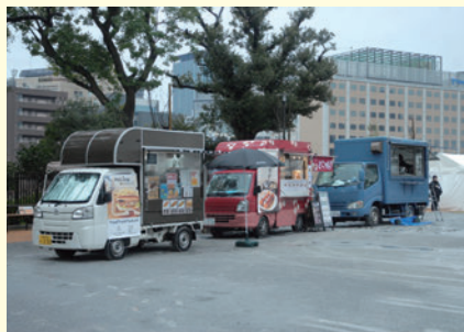
軽食、和洋菓子販売のキッチンカー